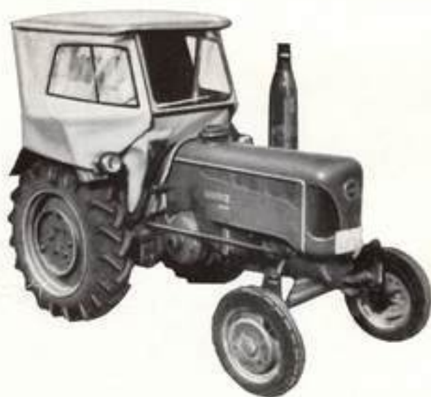
Verdeck mit kurzer Motorverkleidung