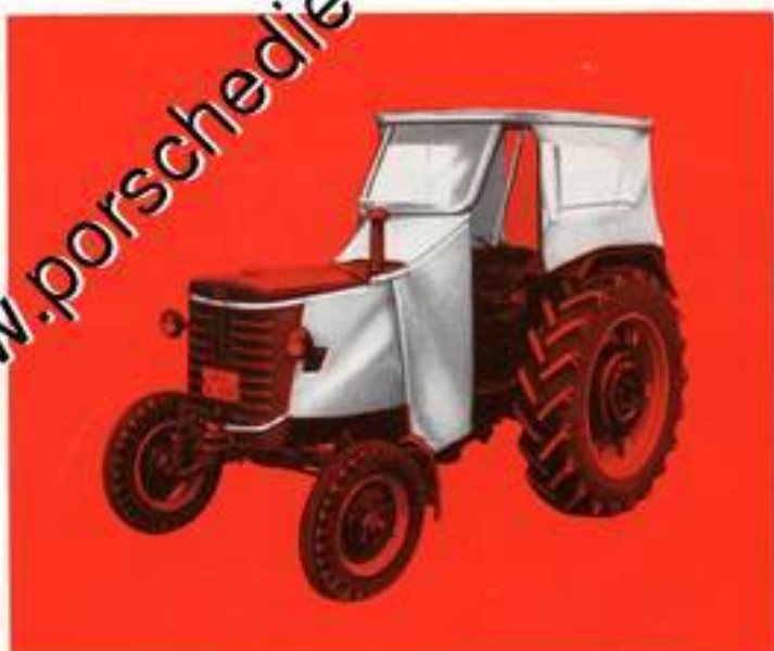
Verdeck mit langer Motorverkleidung. Fronteinstieg durch Zurückschieben der Seitenverkleidung

Durch eine lange Motorvollverkleidung wird das Verdeck zu einer idealen Warmluftkabine. Lieferbar für sämtliche Ferguson-, Fordson- und IHC-Schlepper ab Baujahr 1956. Für alle anderen Typen nur ab Baujahr 1960. Für ältere Schleppertypen ist das Verdeck nur mit kurzer Motorverkleidung lieferbar.