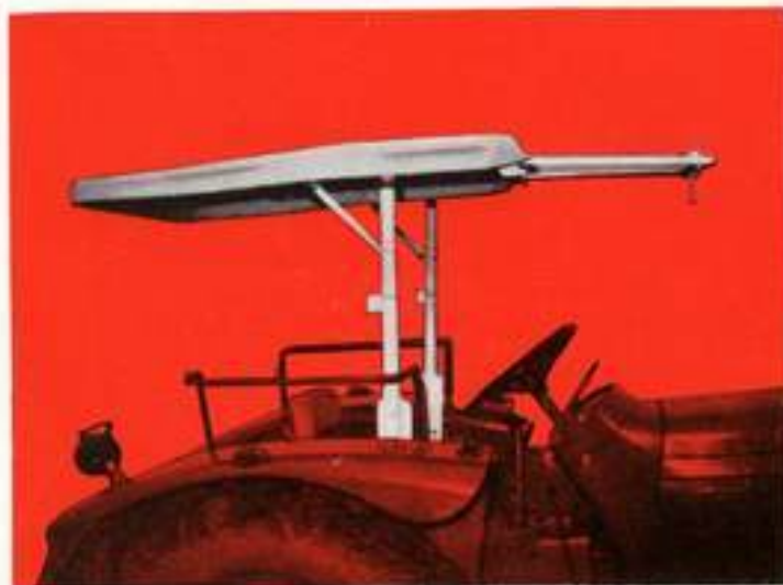
Verdeck mit hochgestellter Frontscheibe. Die Frontscheibe mit Rahmen kann auch abgenommen werden.

Durch eine lange Motorvollverkleidung wird das Verdeck zu einer idealen Warmluftkabine. Lieferbar für sämtliche Ferguson-, Fordson- und IHC-Schlepper ab Baujahr 1956. Für alle anderen Typen nur ab Baujahr 1960. Für ältere Schleppertypen ist das Verdeck nur mit kurzer Motorverkleidung lieferbar.