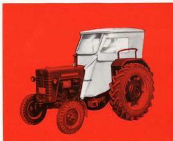
Verdeck mit eingerolltem Motorschutz. In wärmeren Jahreszeiten wird die Heizung durch Abnehmen oder Einrollen der seitlichen Motorverkleidung abgestellt