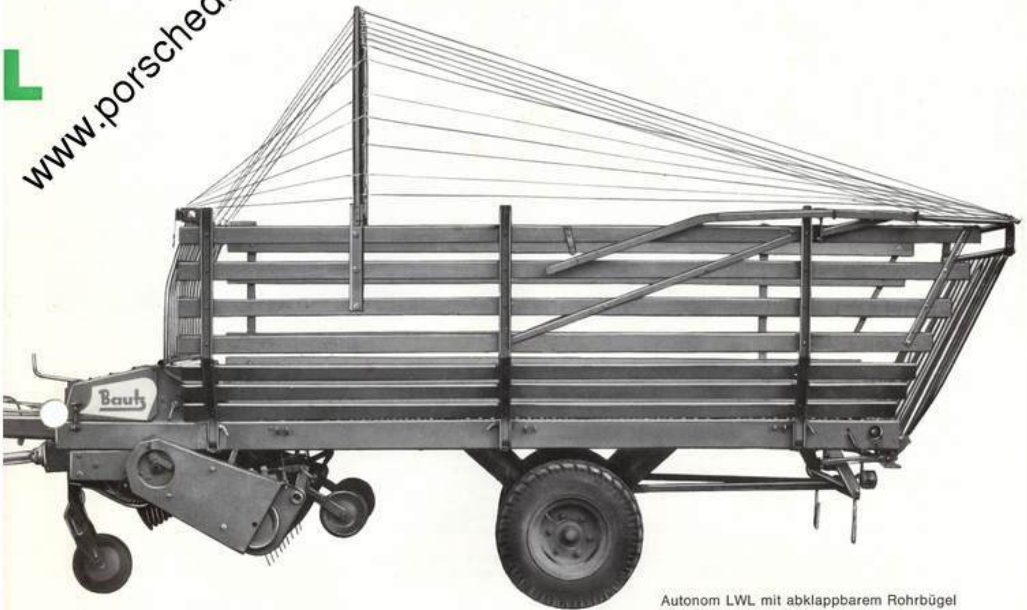
Autonom LWL mit abklappbarem Rohrbügel und Begrenzungsseilen