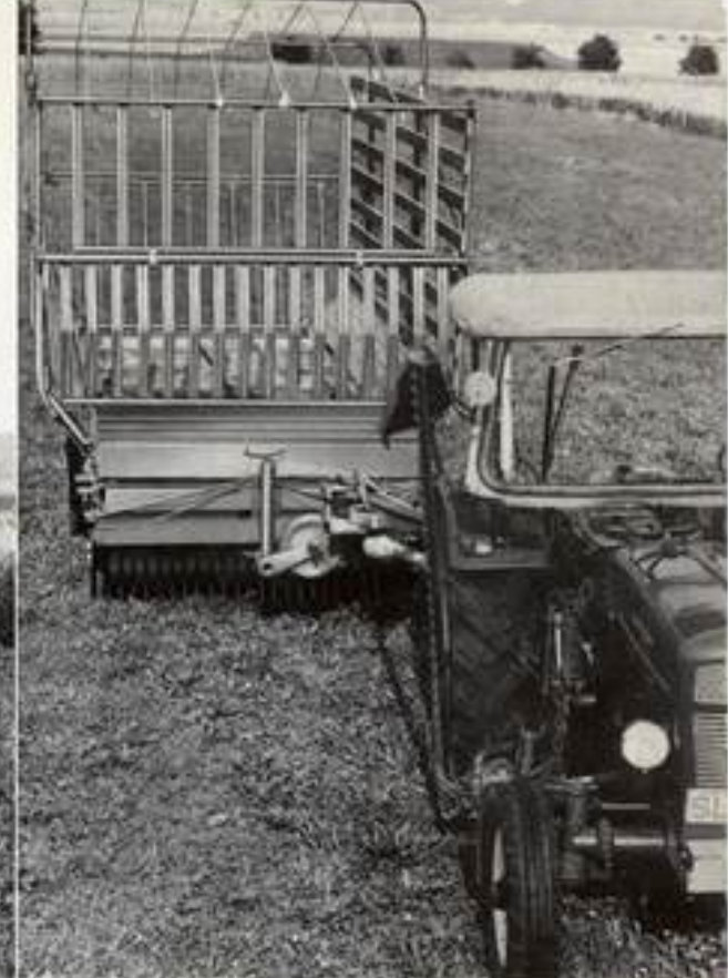
Autonom LWLS mit abklappbarem Dürrfutteraufbau und Bordwänden