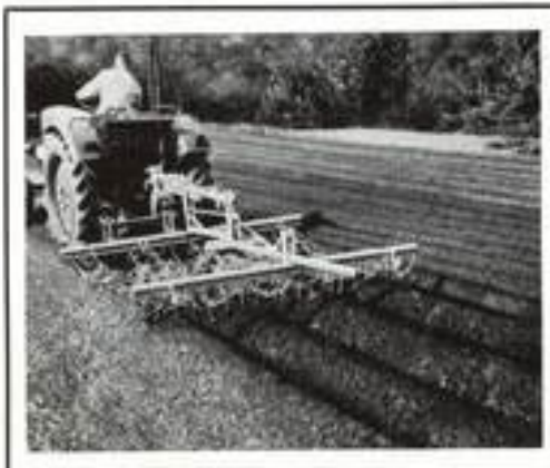
▲ Häuferspurführung N als dreireihiges Häufelgerät, kombiniert mit Netzegge. Diese arbeitssparende Kombination ergibt gute Bodenkrümelung und vermeidet Klutenbildung.