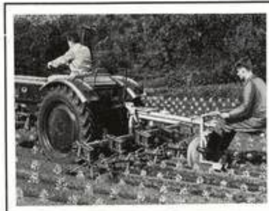
▲ Häuferspurführung S, erweitert zum vierreihigen Kartoffelhackergerät. Die Sitzsteuerung reagiert schnell und garantiert einwandfreies Behacken der Dammflanken und Furchen.

Der CRAMER-Schnellhäufler ist leichtzügig, geeignet für alle Bodenarten und einstellbar für jede Dammform. Seine Arbeitstiefe wird durch Gleitschuhe bestimmt.