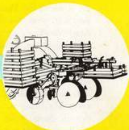
Halbautomatische Kartoffel-Legemaschine mit Handeinlage über Vorratsteller, eingerichtet zum Legen vorgekeimter Kartoffeln.