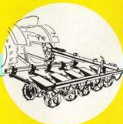
Einkorndrillen verschiedener Fabrikate für Monogermsaat, 2-7-reihig in der CRAMER-Gerätserie.