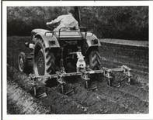
▲ Häuferspurführung S, erweitert zum vierreihigen Häufelgerät mit den bewährten leichtzügigen CRAMER-Schnellhäuflern.