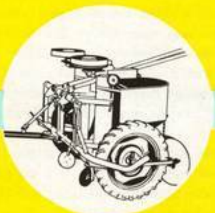
Kartoffel-legeautomat Modell H 2 zweireihige Schlepper-Anhängemaschine mit Handaushebung. Auch mit Eisenrädern und Stecksitz für leichte Seitenhänge lieferbar.