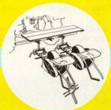
Pflanzensetzmaschinen sind 2-4-reihig lieferbar. Auch Erweiterung auf mechanisches Stecklings- und Topfballenpflanzen möglich.