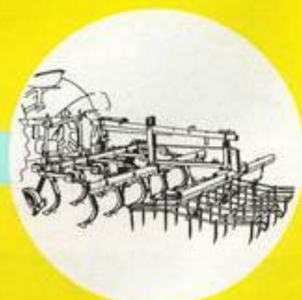
9-zinkiger Grubber, kombiniert mit Ackeregge; auch mit Krümelegege möglich.