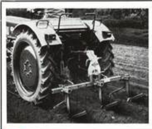
▲ Häuferspurführung N als dreireihiges Häufelgerät mit den leichtzügigen für jede Dammform einstellbaren CRAMER-Schnellhäuflern für hohe Fahrgeschwindigkeit.