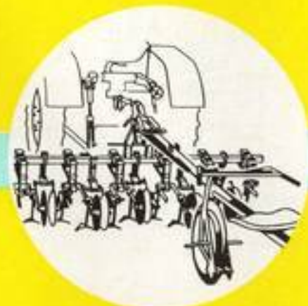
Rübenhackmaschine mit Gänsefuß- oder Winkelmessern an Parallelogrammen und mit allseitig verstellbaren pendelnden Hohlschutzscheiben.