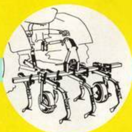
Grubber mit einstellbaren Arnsparzinken für Arbeitsbreiten von 125 bis 220 cm mit 7-11 Zinken.