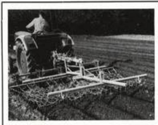
▲ Häuferspurführung S, erweitert zum vierreihigen Häufelgerät, kombiniert mit Netzegge; schafft beste Voraussetzungen für den Sammelroder.