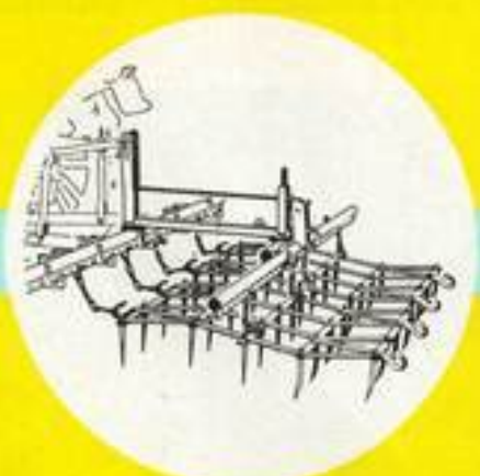
Der Eggenträger nimmt in Verbindung mit weiteren Wiederholungsteilen Acker-, Saat- und Netzeggen jeder Art und Arbeitsbreite auf.