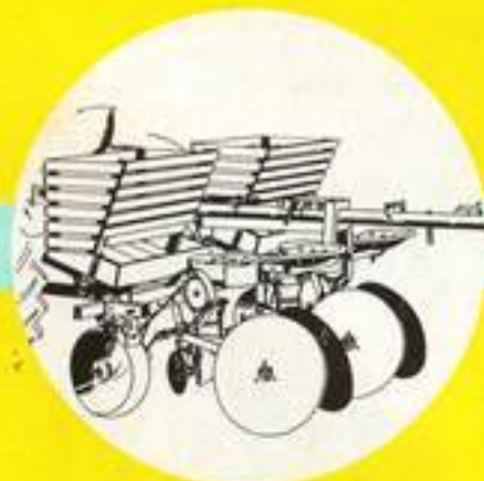
Halbautomatische Kartoffel-Legemaschine mit Handeinlage über Vorratsteller, eingerichtet zum Legen unbehandelter Kartoffeln.