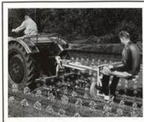
▲ Häuferspurführung N als dreireihiges Kartoffelhackergerät, mit höhen- und seiteneinstellbaren Gänsefußmessern; wahlweise auch mit Kultivatorzinken lieferbar