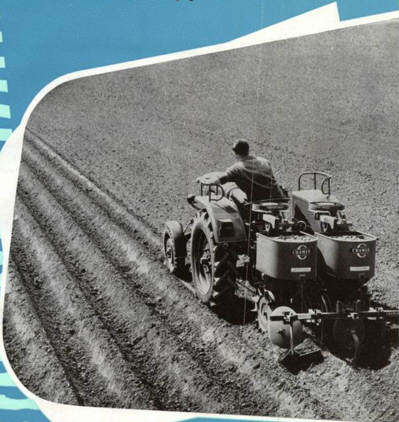
Kartoffel-legeautomat Modell BD 2 mit Häuferspurführung

Dieser Prospekt zeigt die Kartoffel-legeautomaten