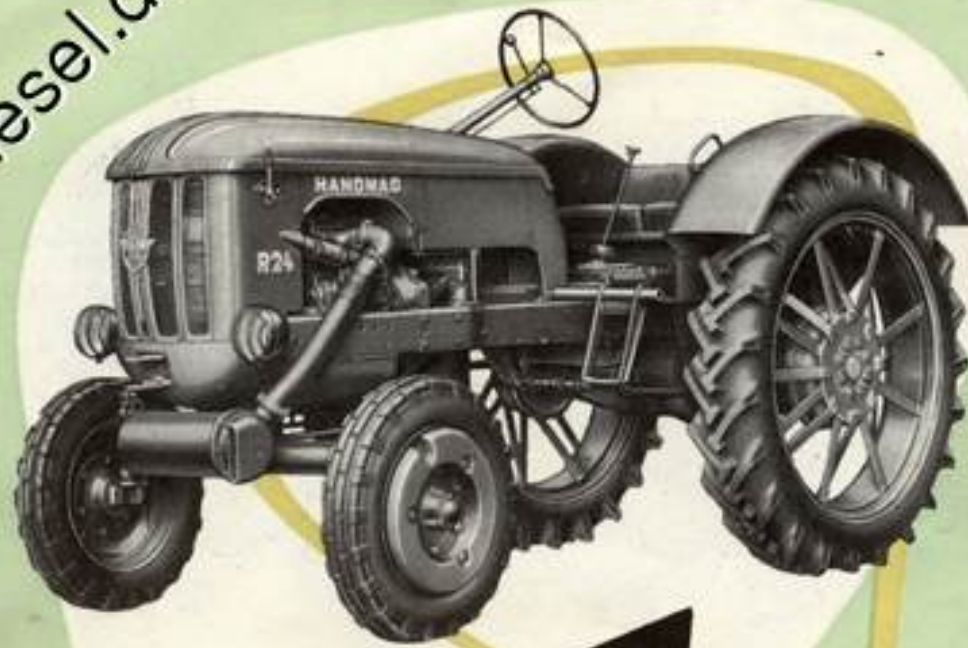
R 24/24 PS

2-Zylinder-Diesel-2-Taktmotor; Hubraum 1021,4 cm 3 ; mit elektr. Anlasser; 6 Vorwärts- und 2 Rückwärtsgänge; Gesamtlänge 3100 mm; Eigengewicht 1360 kg; Spurweiten 1250/1375/1500 mm; Bereifung Hinterräder 8—36 AS.