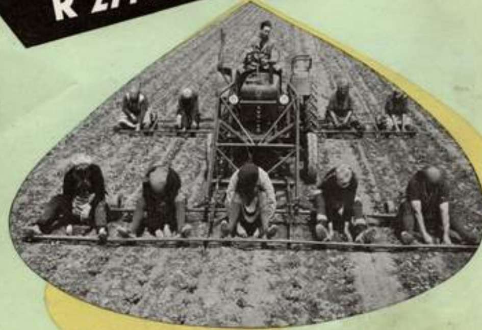
R 27/27 PS

3-Zylinder-Diesel-4-Taktmotor; Hubraum 2099 cm mit elektr. Anlasser; 5 Vorwärtsgänge und 1 Rückwärtsgang. Gesamtlänge 2720 mm; Eigengewicht 1520 kg; Spurweiten 1250/1400/1550 mm; Bereifung Hinterräder 8—36 AS.