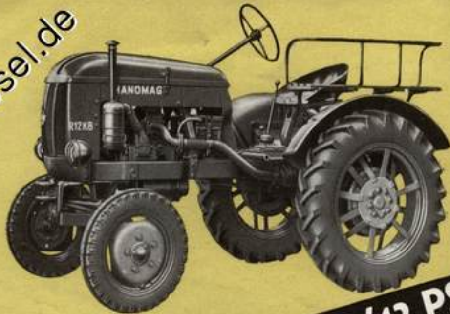
R 12 KB/12 PS

1-Zylinder-Diesel-2-Taktmotor; Hubraum 510,7 cm 3 ; mit elektr. Anlasser; 6 Vorwärts- und 2 Rückwärtsgänge; Gesamtlänge 2340 mm; Eigengewicht 890 kg; Spurweiten 1250/1375/1500 mm; Bereifung Hinterräder 8—24 AS.